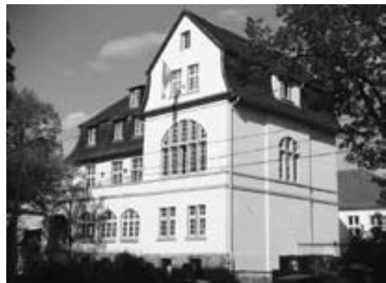
Das Rhenanienhaus Jena in der Saalbahnhofstraße 19