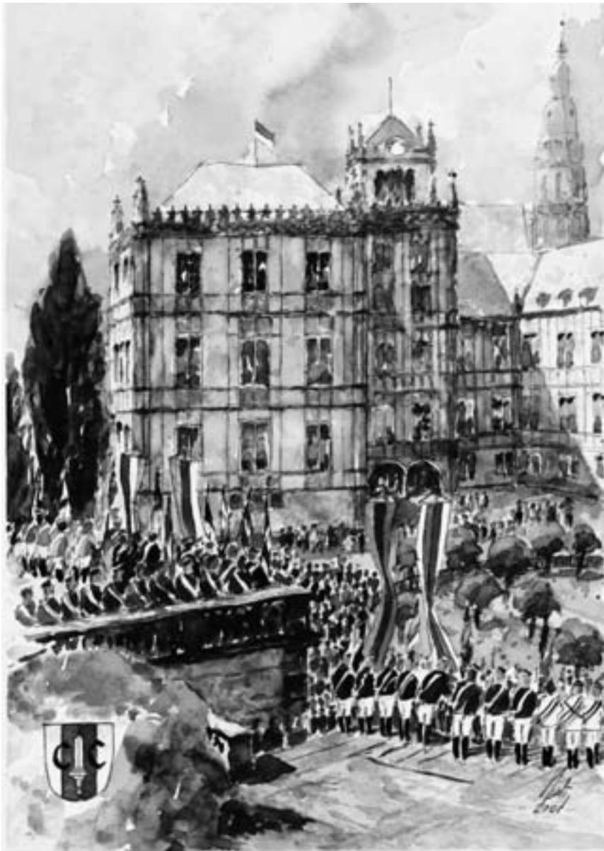
Zeichnung: Gerhard Peetz, Coburg

In der Mitte dieser CC-Blätter finden Sie zum Entheften ein Gesamtverzeichnis der Anschriften unserer Amtsträger, Aktivitates, Altherrenschaften und VACC (Änderungen und Ergänzungen wollen Sie bitte der CC-Kanzlei mitteilen, die die Zusammenstellung besorgt hat). Daher mußten wir den redaktionellen Teil dieser CC-Blätter verkürzen und einige hier vorliegende Beiträge und Leserbriefe auf das nächste Heft verschieben. Es wird bereits in wenigen Wochen – noch vor dem Pfingstkongreß – erscheinen.