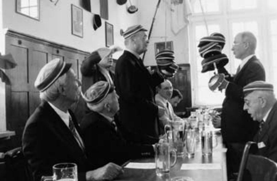
Burschenfeier im Kneipsaal des Rhenanenhauses

nale Träume, wie sie einige träumten und denen einige wenige weiter nachhängen, sind ausgeträumt. Davon, wie wir uns als Nation begreifen, hängt viel ab. Nur wer seine Identität annimmt, kann sie auch einbringen in Europa und in der Welt.