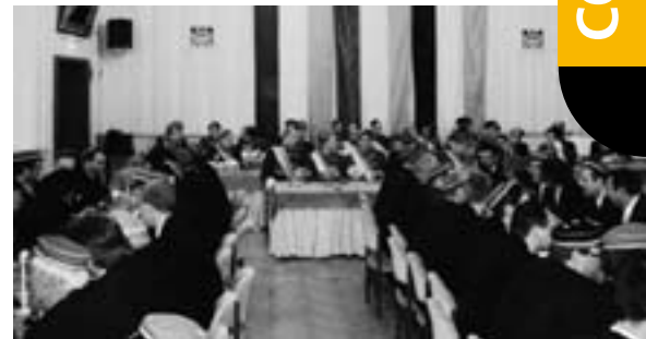
Chargierte und Festcorona kommersieren im großen Saal des Hotels ›Schwarzer Bär‹

(Die ungekürzten Reden sind in der nachzulesen unter www.rhenania-jena.de )