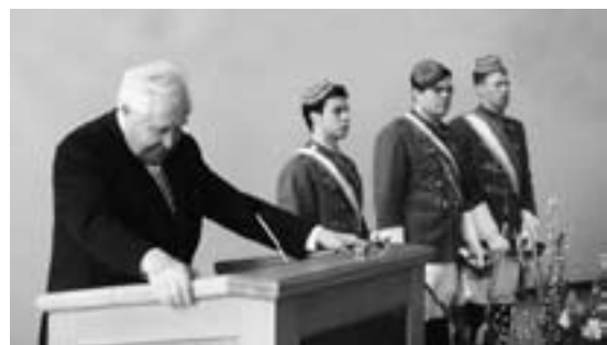
Prof. Dr. Bernhard Vogel hielt den Festvortrag

Der frühere Ministerpräsident Thüringens, Prof. Dr. Bernhard Vogel plädierte in seinem Festvortrag für einen gesunden Patriotismus ohne jeden nationalistischen Anklang. Seine Analyse: »Die Angst vor falschen, nationalistischen Tönen – vor Tönen, die missdeutet werden könnten – ist gewichen. Aber wir Deutschen sind gleichwohl längst noch nicht mit uns im Reinen, können es nach dem Geschehenen auch nicht sein. Bis heute stellt sich die Frage nach unserem nationalen Selbstverständnis.